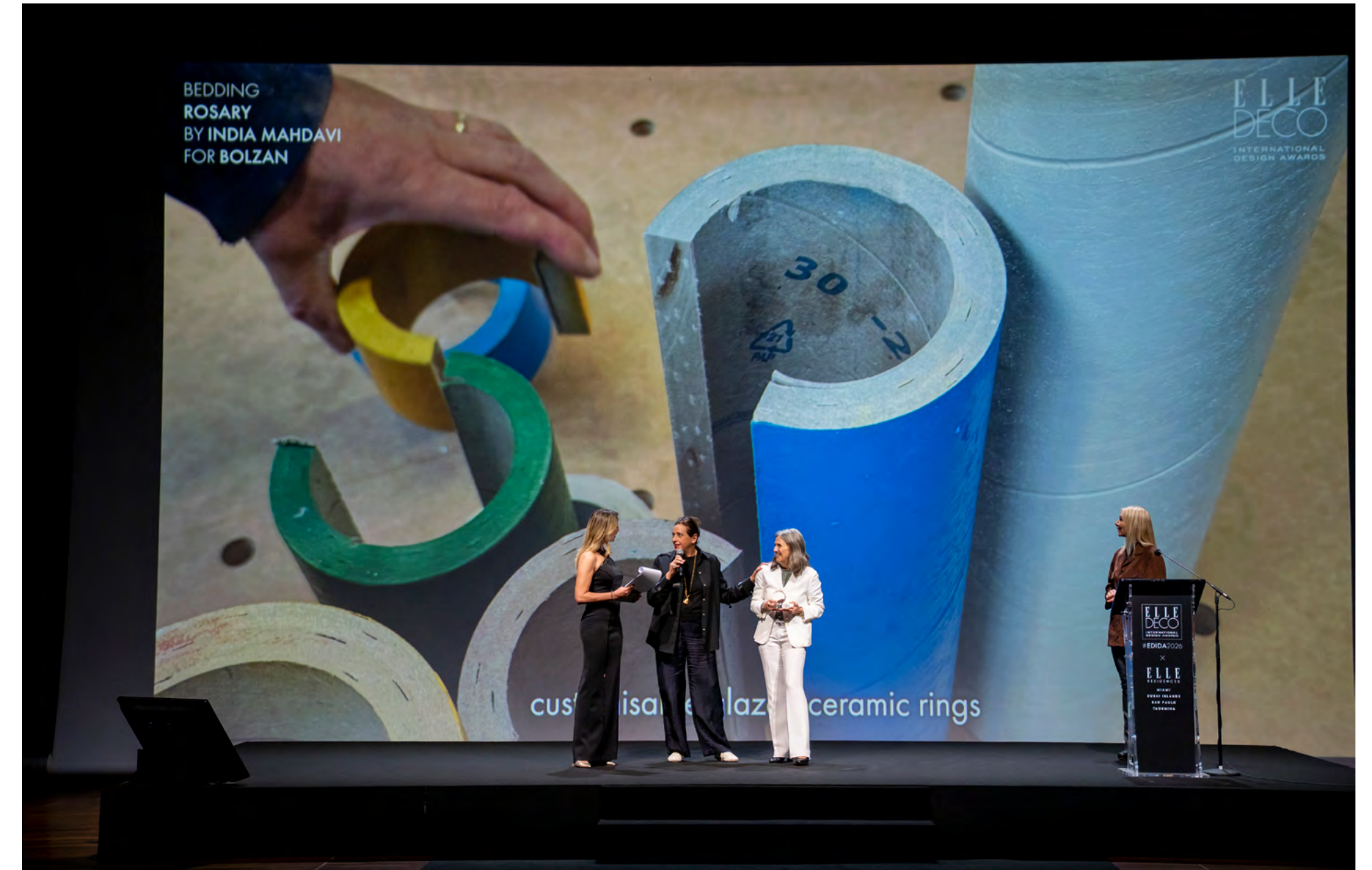
Foto dalla cerimonia di premiazione, con un discorso della designer India Mahdavi